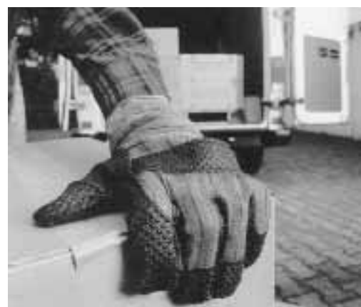
Figure 5: des gants protègent des blessures.