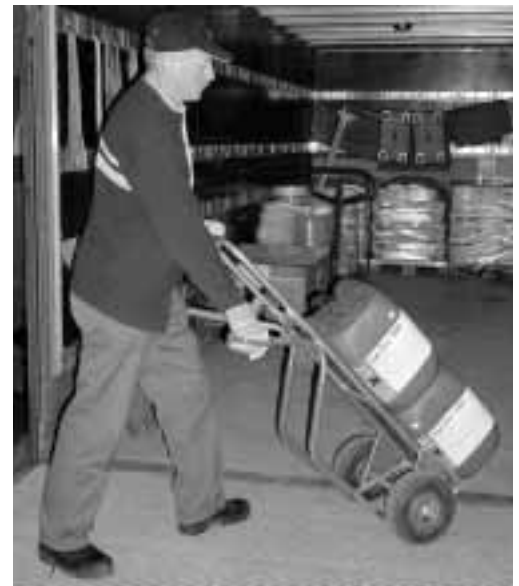
Figure 2: utilisation d'équipements appropriés.