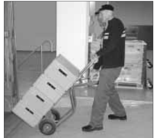
Figure 1: zone de chargement et de déchargement suffisamment éclairée et protégée de l'humidité.